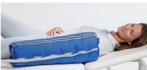
Armmanschette mit 6 Luftkammern durchgehender Reißverschluss Oberarmumfang bis 60 cm, Länge 67 cm