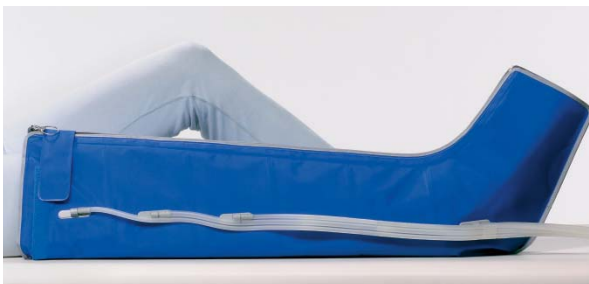
Beinmanschette mit 6 Luftkammern durchgehender Reißverschluss, Klettverschluss Größe M: Oberschenkelumfang bis 70 cm, Länge 85 cm Größe L: Oberschenkelumfang bis 83 cm, Länge 85 cm

Der durchgehende Reißverschluss erleichtert Anlegen und Reinigen. Ein zusätzlicher Klettverschluss ermöglicht eine optimale Anpassung im Bereich des Oberschenkels.