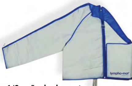
1/2 puño de chaqueta con 12 cámaras de aire a la derecha con bolereo Art. n° 1182