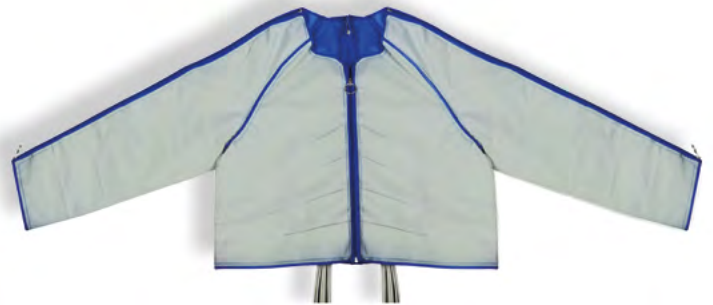
Manguito de chaqueta con 24 cámaras de aire Artículo n° 1180