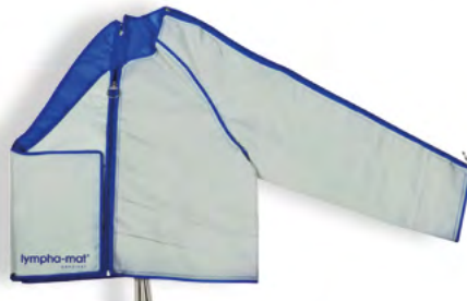
1/2 puño de chaqueta con 12 cámaras de aire a la izquierda con bolereo Art. n° 1181